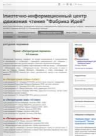
блог «БИЦ продвижения чтения «Фабрика Идей»