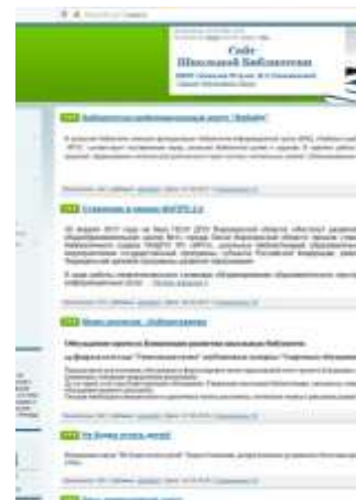
веб-сайт «Школьная библиотека»