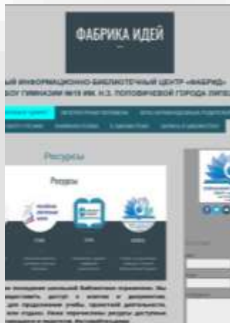
веб-сайт ШИБЦ «Фабрика Идей»